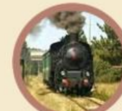
Treno della Sila