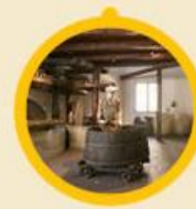
Museo dell'Olio di Oliva