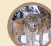
Il Lupo della Sila