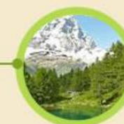
Parco nazionale della Sila