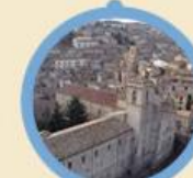
San Giovanni in Fiore