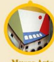
Museo Arte Contemporanea Aeri