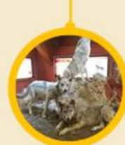
Museo Della Biodiversità