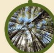
I Giganti della Sila