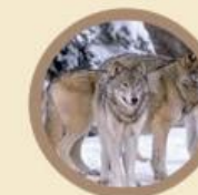
Il Lupo della Sila